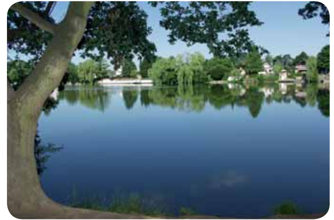
Ternscher Meer, Selm