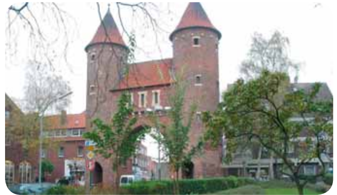
Lüdinghauser Poort, Dülmen

Openingstijden: van 1 maart tot 1 november elke zaterdag, zondag en feestdag van 10 tot 18 uur