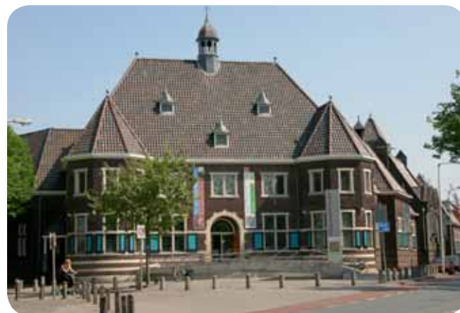
Rijksmuseum Twenthe, Enschede