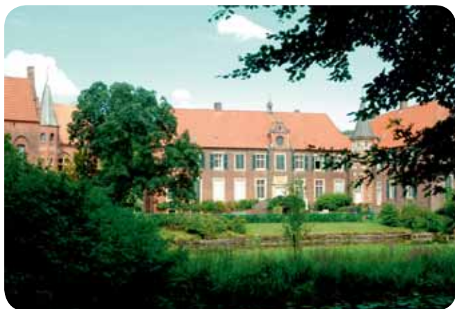
Huis Egelborg, Legden