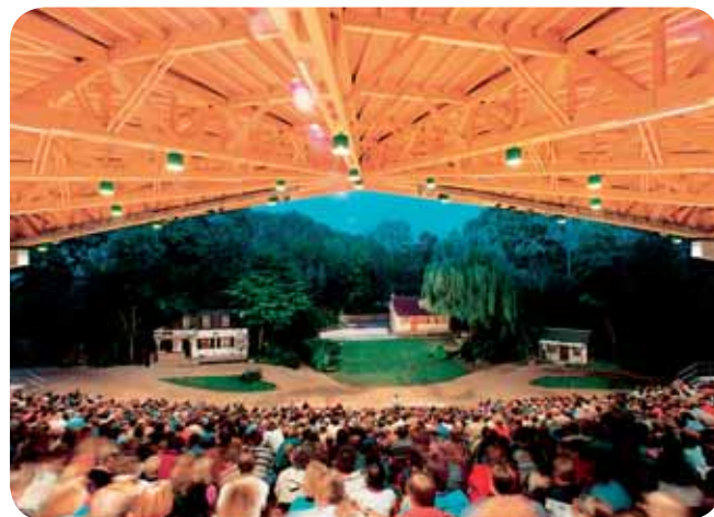
Waldbühne Heessen, Hamm