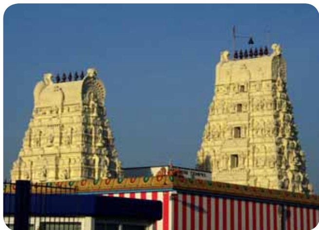
Sri Kamadchi Ampal Tempel, Hamm