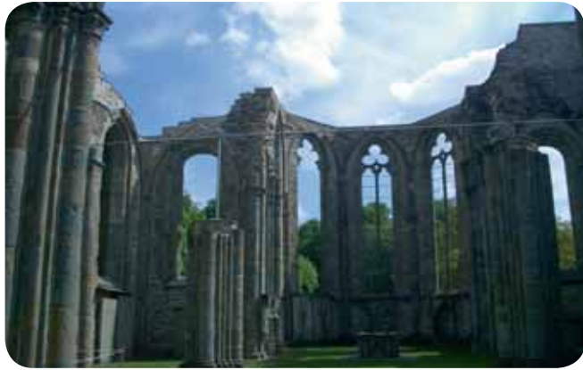
Stiftsruine St. Marien, Lippstadt