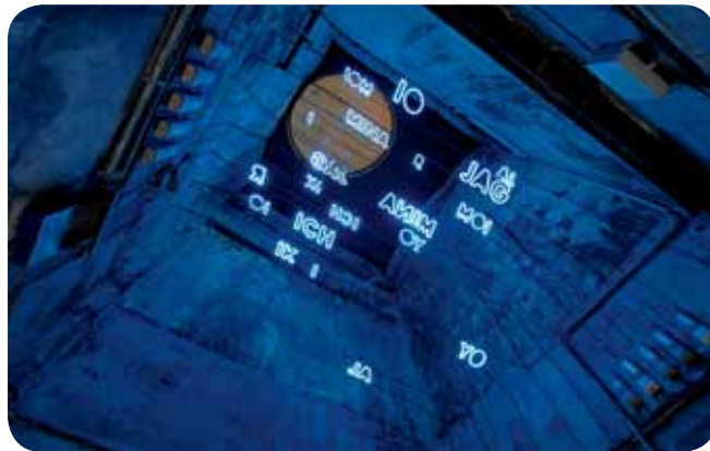
Zentrum für Internationale Lichtkunst Unna