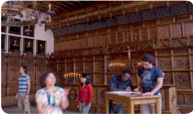
Friedenssaal im historischen Rathaus, Münster