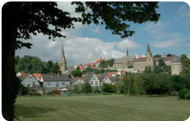
Südansicht von Warburg