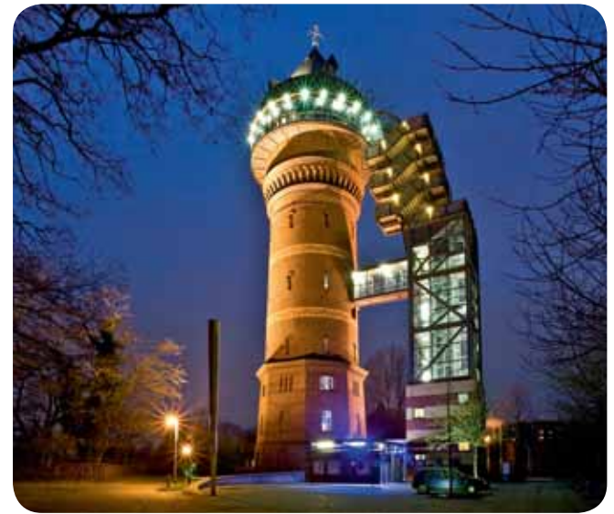
Aquarius Wassermuseum, Mülheim an der Ruhr