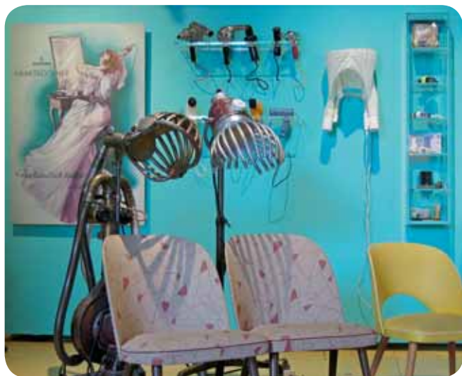
Umspannwerk Recklinghausen – Museum Strom und Leben