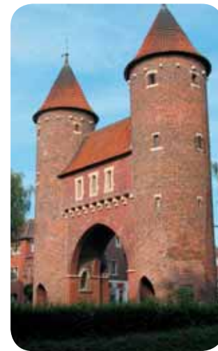
Lüdinghauser Tor, Dülmen

Das heutige Wahrzeichen der Stadt Dülmen verweist als steinerner Zeuge auf mittelalterliche Zeiten. Die Rundtürme des Lüdinghauser Tores wur-