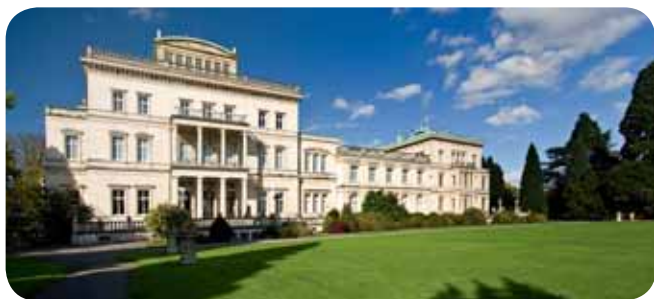
Villa Hügel, Essen