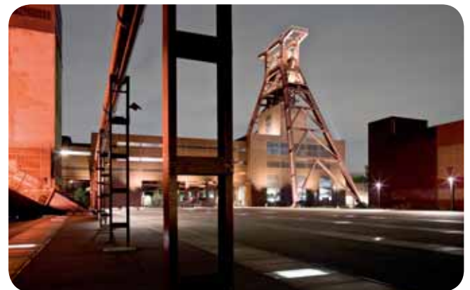
Zeche Zollverein, Essen